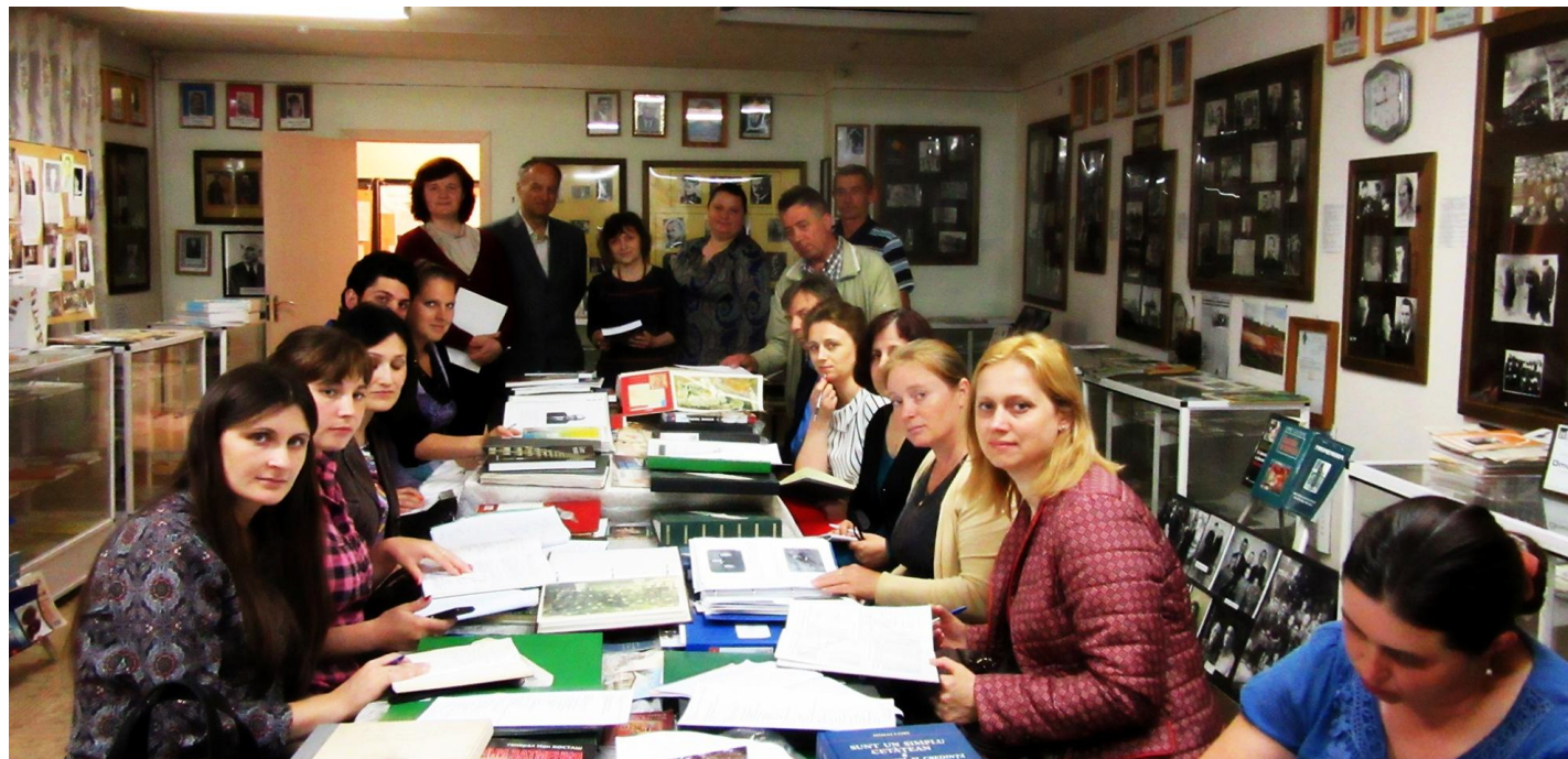
Seminarul teoretico-practic „Istoria orală – aspecte și perspective didactice” pentru profesorii școlari, Muzeul „Memoria Neamului”, 15 iunie 2016, m. Chișinău